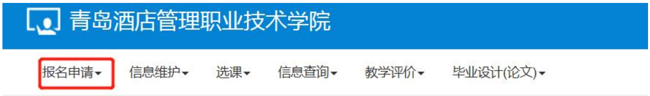
图一：点击“报名申请”

网址为： http://my.qchm.edu.cn/ ，点击教务系统，出来如下界面，选择报名申请—学籍异动申请—退学—同意