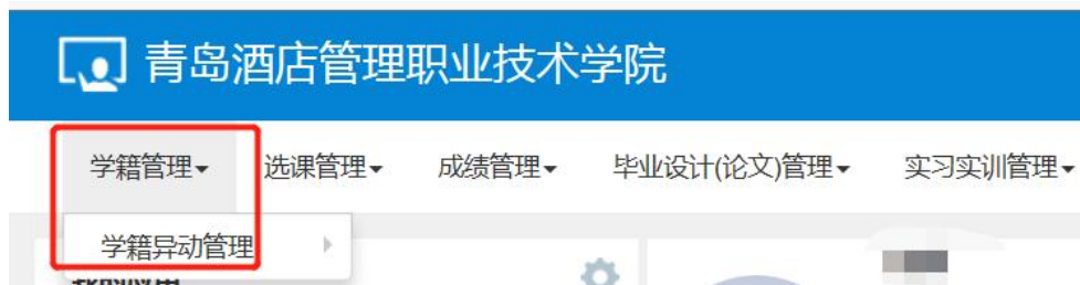
图一：选择学籍管理—学籍异动管理