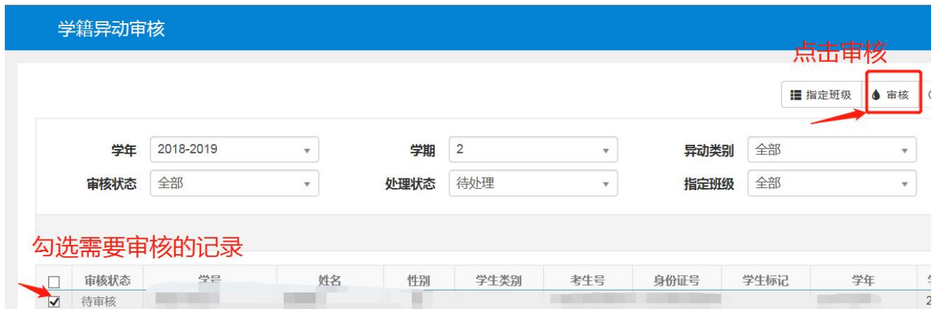
图二：勾选待审核的记录，点击审核