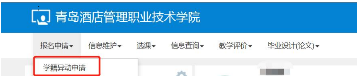
图二：点击“学籍异动申请”